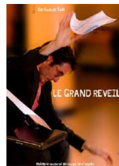
Création 2022 Théâtre musical de corps et d'objets Tout public à partir de 6 ans