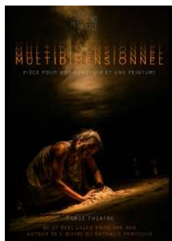
Création 2020 Pièce pour une danseuse et une peinture Tout public à partir de 11 ans