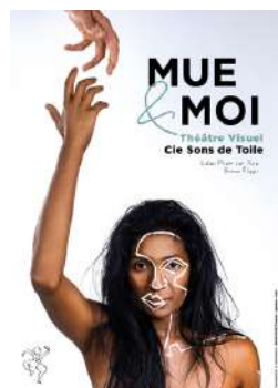
Création 2017 Théâtre visuel et sonore Tout public, pour les entendants et malentendants à partir de 7 ans