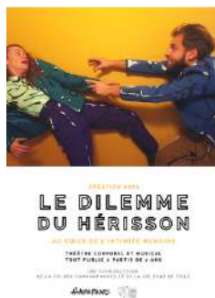
Création janvier 2023 Théâtre corporel et musical Tout public à partir de 7 ans