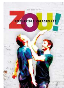
Création 2011 Duo de percussions corporelles Tout public