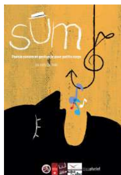
Création 2016 Poésie sonore et gestuelle 6 mois - 3 ans